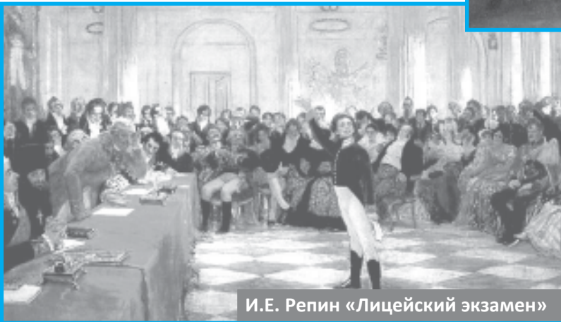
И.Е. Репин «Лицейский экзамен»

Полную версию статьи читайте на сайте coe.ulstu.ru