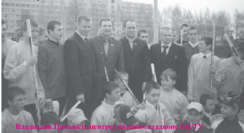
Владислав Третьяк (в центре) на новом стадионе УлГТУ

7 мая на стадионе УлГТУ состоялась презентация Малых Олимпийских игр . Даже житель самой далекой глубинки мечтает, чтобы когда-нибудь именно в его городе прошли Олимпийские игры. А вот мечты ульяновцев, кажется, сбылись. В сентябре в нашем городе стартуют вторые Олимпийские игры. Первые проводились в 2005 г. в Саранске, а благодаря инициативе местных властей, в этом году именно нашему городу выпала честь принимать у себя Олимпиаду.